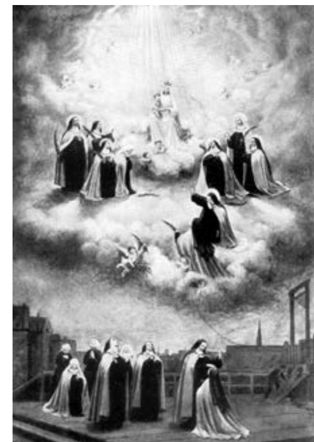
A compiègne-i kármelita vértanúk kivégzése – illusztráció Louis David OSB 1906-os könyvéből (public domain).